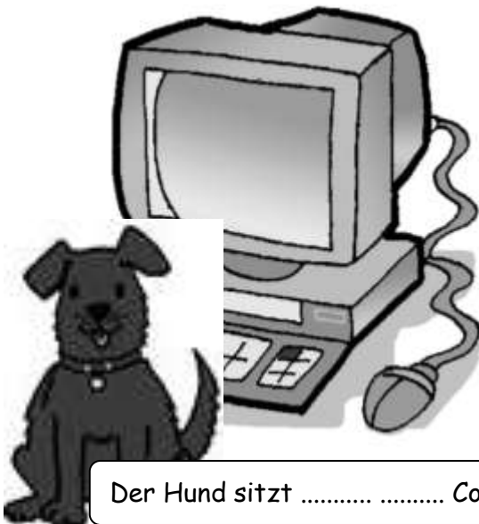
Der Hund sitzt ..... Computer.