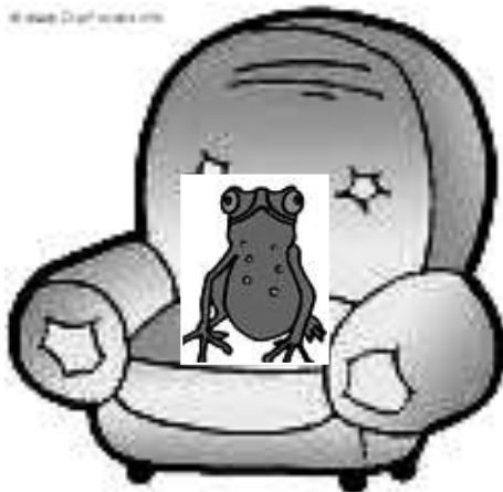
Der Frosch sitzt ..... Sessel.