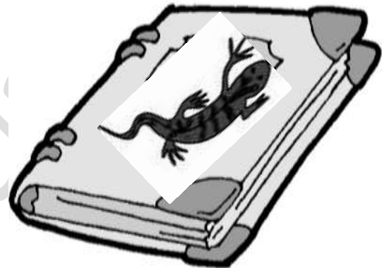
Die Erdèche lieg ..... Buch.