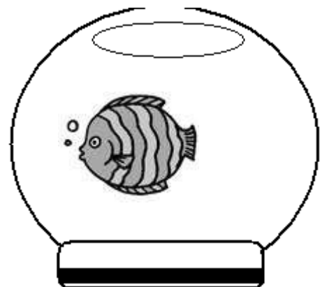
Der Fisch schwimmt ..... ..... Aquarium.